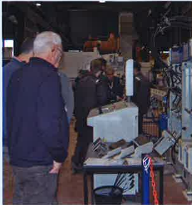
Les "EVOpen Days" se sont déroulées au siège de la société, rue de la Brot à Dijon.

Deux ans après avoir proposé ses "Journées Techniques", Vernet Behringer a organisé les 6 et 7 décembre ses troisièmes portes ouvertes, les "EVOpen Days". L'occasion, durant deux jours, de permettre aux clients, partenaires mais aussi à des jeunes de mieux connaître l'entreprise, son fonctionnement et l'éventail des produits et services qu'elle propose.