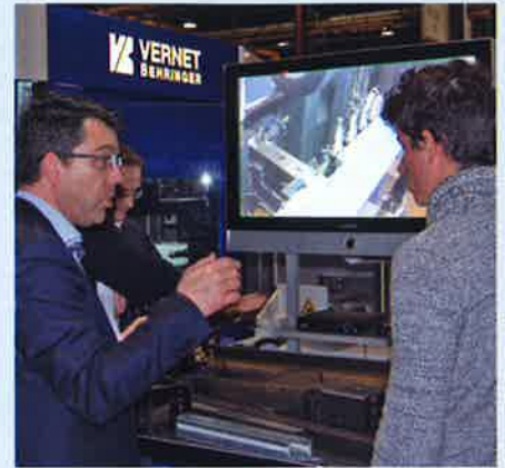
Des écrans permettaient de voir fonctionner "en live" les machines.

S écialisée dans la fabrication de lignes de production destinées aux charpentiers, spécialistes des pylônes, serruriers métalliques..., Vernet Behringer compte aujourd'hui quelque 140 salariés. Fondée à Dijon il y a plus de 135 ans, l'entreprise, qui produisait des poinçonneuses et des cisailles permettant de travailler les métaux de plus ou moins forte épaisseur, a, au fil du temps, considérablement étoffé son savoir-faire et propose désormais une large gamme de lignes de productions combinant perçage, poinçonnage, sciage, cisailage, marquage ou encore découpe plasma.