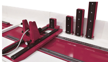
Etaux avec mors interchangeables Interchangeable clamping jaws Spannstockvorrichtung mit verstellbarer Backe