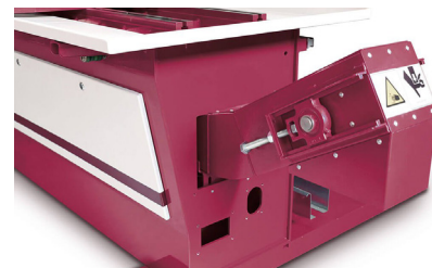
Convoyeur à copeaux Chips conveyor Späneförderer

ZAE CAPNORD - BP 37423 13, RUE DE LA BROT F-21074 DIJON CEDEX PHONE : +33 380 73 21 63 CONTACT.US@VERNET.BEHRINGER.NET