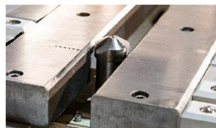
Ebavurage par le dessous Underneath deburring unit Entgratsystem von unten