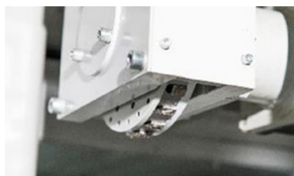
Marqueuse disque Disc marking unit Typenrad-Markiereinheit