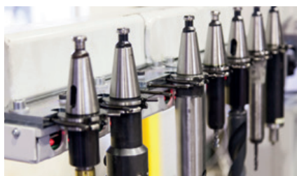
Changeur d'outils étendu Extended tool changer Erweiterter Werkzeugwechsler