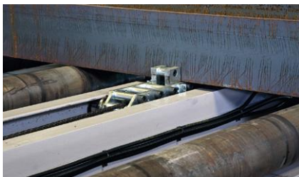
Ripeur de chargement à doigt escamotable Loading chain with retractable finger Kettenförderer mit einziehbarer Nocke