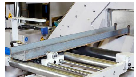
Étau de reprise Repositioning vise Übernahme-Spanneinheit

ZAE CAPNORD - BP 37423 13, RUE DE LA BROT F-21074 DIJON CEDEX PHONE : +33 380 73 21 63 CONTACT.US@VERNET-BEHRINGER.COM