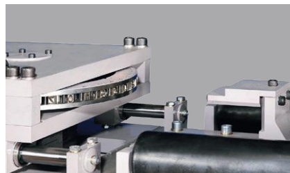
Marqueuse disque Disc marking unit Typenrad-Markiereinheit