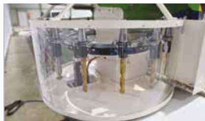
Changeur d'outils 10 diamètres Tool changer 10 diameters Werkzeugwechsler 10 Durchmesser