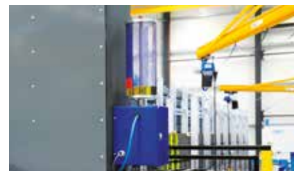
Micro-lubrification par le centre des forets Micro-lubrication system through the drills Innenminimalmengschmierung

ZAE CAPNORD - BP 37423 13, RUE DE LA BROT F-21074 DIJON CEDEX PHONE : +33 380 73 21 63 CONTACT.US@VERNET-BEHRINGER.COM